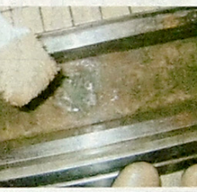
図6 排水口のぬめり

な問題点として、①床が滑りやすい、②洗い場の汚れが複合化され落ちない、③清掃時間がかる、④清掃時の大変な疲労感、⑤カビの発生、⑥鏡・ガラスのウロコ、⑦臭いの発生、⑧高温多湿の労働環境、⑨レジオネラ菌、大腸菌等の対策、⑩配管や浴槽の老朽化など、さまざま問題・課題がある中、浴室清掃は、従来とは根本的に清掃システムを変えなければ、解決しないという事を実感し、これまで