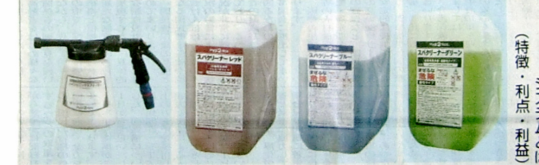
図7 ハイジエニックス フォーマー スパクリーナー レッド スパクリーナー ブルー スパクリーナー グリーン

ビルメンテナンス社 〒100-0001 東京都千代田区千代田1-1-1 TEL: 03-222-0163 FAX: 03-222-0162 〒100-0001 東京都千代田区千代田1-1-1 TEL: 03-222-0163 FAX: 03-222-0162