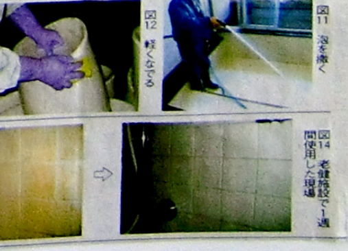
図11 泡を撒く 図12 軽くなでる 図13 すすぐ 図14 老健施設で1週間に1回使用した現場

昨年10月に「スパクリーナー グリーン」を発売しました。この商品は、クエン酸を使用しており、弱酸性で手肌と同じpH(ペーハー)となり、排水規制されている現場でも使用できると共に、「親水性膜形成剤」を配合し、汚れ付きにくい状態にします。ビジネスホテルのユニットバスなど1分の清掃時間短縮を求められている場所などに最適です。