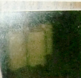
図5 鏡のウロコ状現象