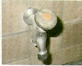
図2 石灰カスと垢汚れが複雑に付着した蛇口